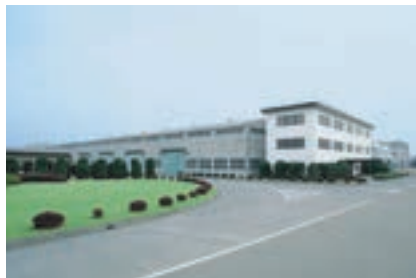
群馬工場 (群馬県太田市)