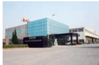
加藤(中国)工程机械有限公司(中国江蘇省昆山市)