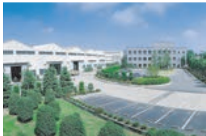
茨城工場 (茨城県猿島郡五霞町)