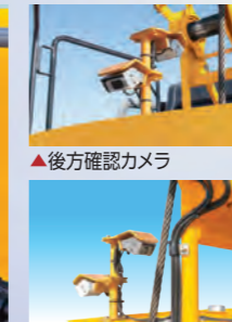
▲ウインチ確認カメラ