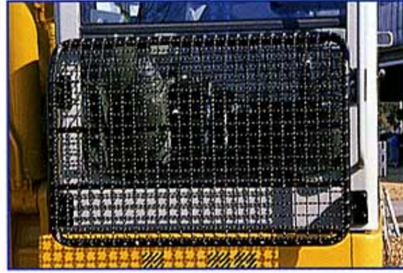
ベンチレータネット (オプション仕様)