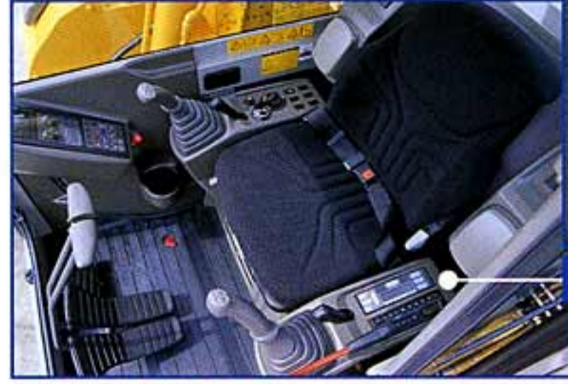
ゆったりスペースのワイドキャブ内