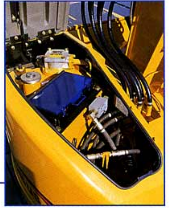
大型工具箱/間口の広い開口部