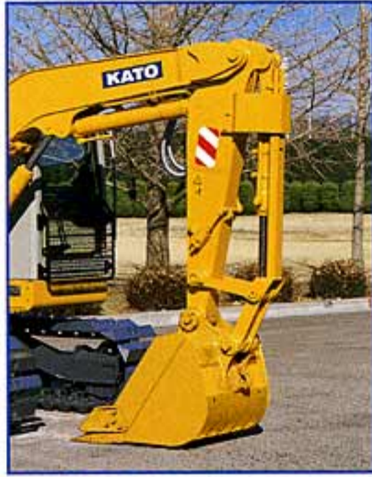
損傷防止ガード (標準仕様)