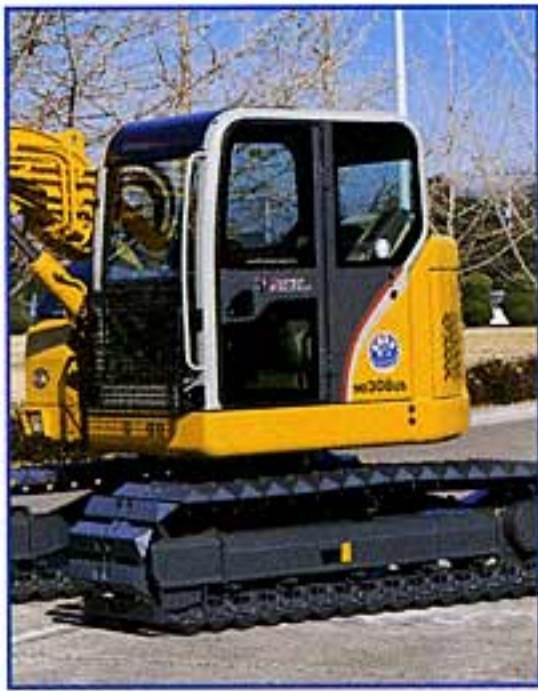
新設計低車高キャブ