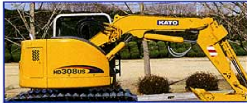
左側面集中配管 (標準仕様)