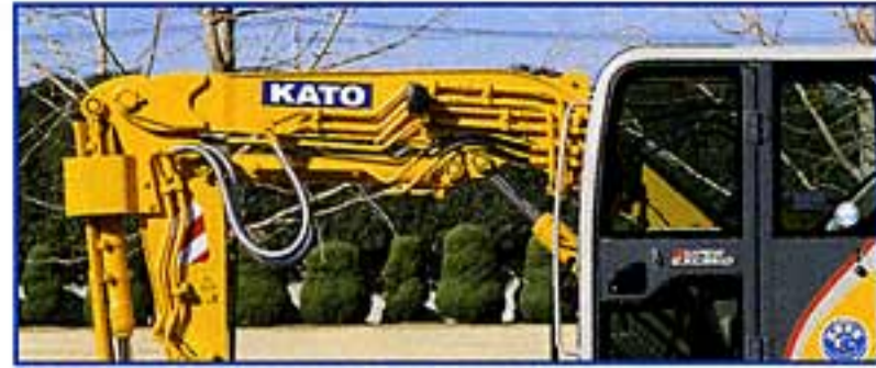
共用配管 (オプション仕様)