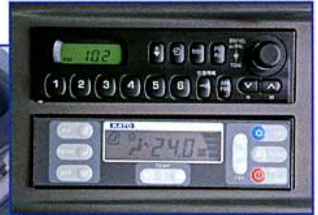
ラジオ/オートエアコン (オプション仕様)