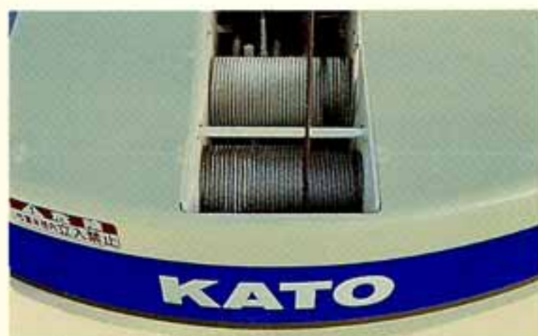
●スピーディな複合操作ができる強力なウインチ機構