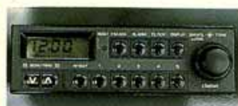
●選局はボタンひとつで簡単、デジタル時計付AM/FMラジオ(2スピーカー)