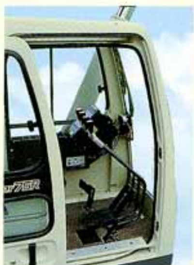
●足もとが広くデラックスで豪華なフロアマット