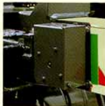
●アウトリガ張出し幅自動検出装置

●作業や現場状況に合わせて最縮小張出し幅1.98m、中間張出し幅3.0mと、最大張出し幅4.4mの3段階にキメ細かく張出し幅が設定できACSコンピューロードに組込まれた「アウトリガ張出し幅自動検出装置」により、常に安定した状態で作業が安全に行えます。