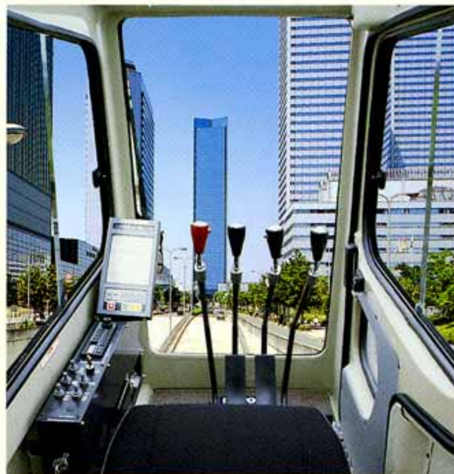
●ゆったりとした居住空間を確保、シックでデラックスな快適キャブ

●現場で働く人や周囲の人々に注意を促すとともに、狭い現場や夜間作業時の安全性をさらに向上させる、旋回警告灯を標準装備しました。