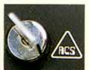
●ACS解除スイッチ(キー式)