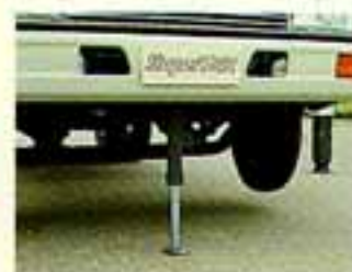
●全周同一つり上げ性能を発揮する油圧式フロントジャッキ

クラスで最もコンパクト設計 小さなテールスイング1.55m 狭い現場内の移動がじつにスムーズ