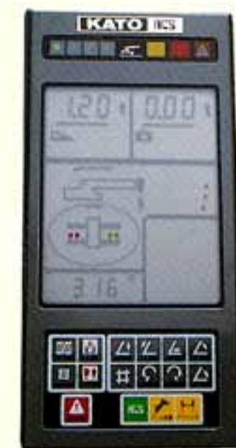
●アウトリガ張出し幅自動検出装置と作業範囲制限機能付コンピュータ

●「ドラム回転インジケータ」を内蔵した、最新鋭のACSコンピュロードにより、ウインチドラムの微妙な回転状態をACSのパネル上で確認することができます。しかも、ウインチレバーに装着されたスイッチを押すとドラムの回転状態を音でも知らせますので、安心して確実な操作が行えます。