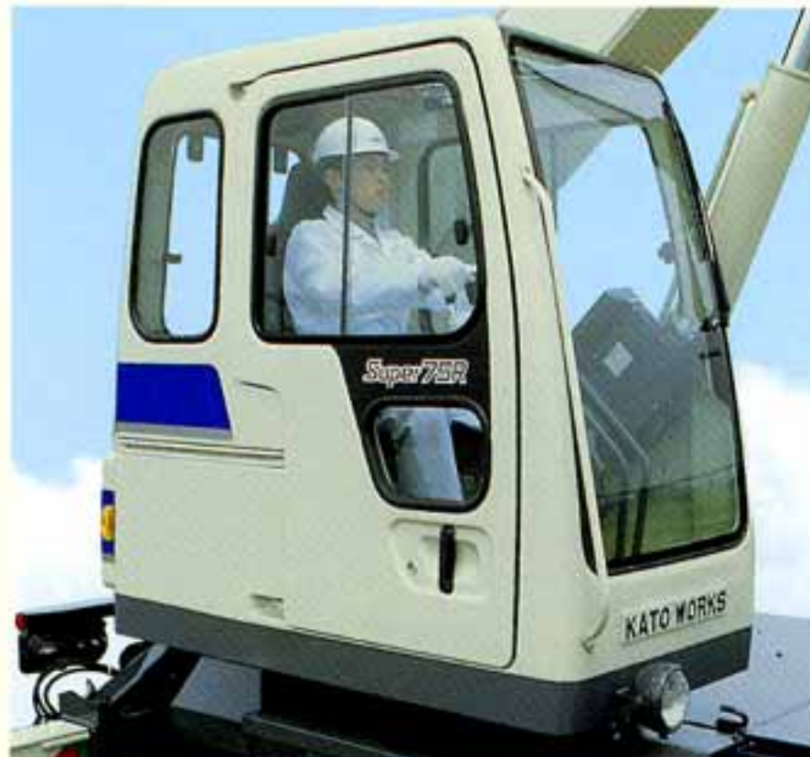
●ウォッシュ付大型強化ガラス窓採用。超広角視界設計で作業視界もアップ。