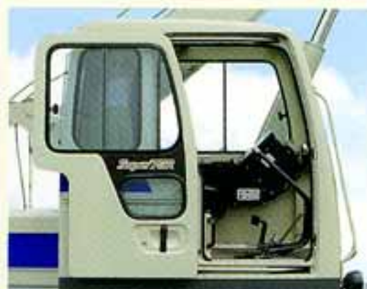
●乗り降りがラクな「スライドドア」