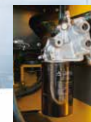
▲エンジンオイル フィルタ リモート化