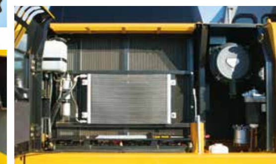
▲清掃を手軽にしたコア並列型ラジエーター