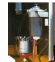
▲燃料フィルタ リモート化