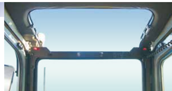
▲前上方の棧を無くし、天窓開放時の視界を確保