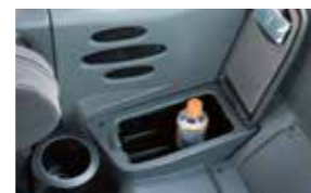
▲大型ホット&クールボックス