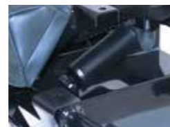
▲大型ショックアブソーバー