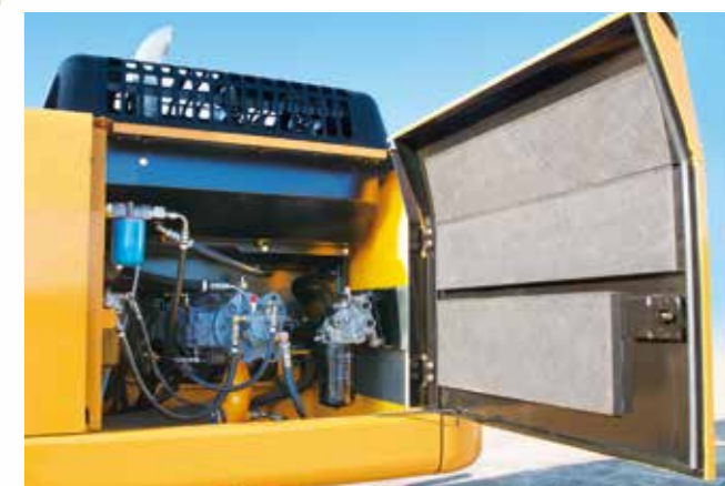
▲清掃等のメンテナンススペースを 広くとったレイアウト