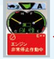
◀エンジン非常 停止スイッチ 操作時