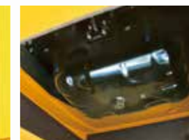
▲ドレンコック (初回点検時装着)