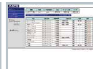
▲メンテナンスデータ情報