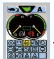
◀イニシャル チェック画面