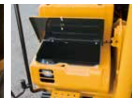
▲ガススプリング付 大容量のツールボックス